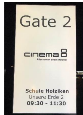
Kinobesuch mit der Primarschule

Ich wünsche allen schöne und besinnliche Festtage und fürs 2019 alles Gute!