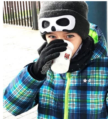
Tag der Pausenmilch