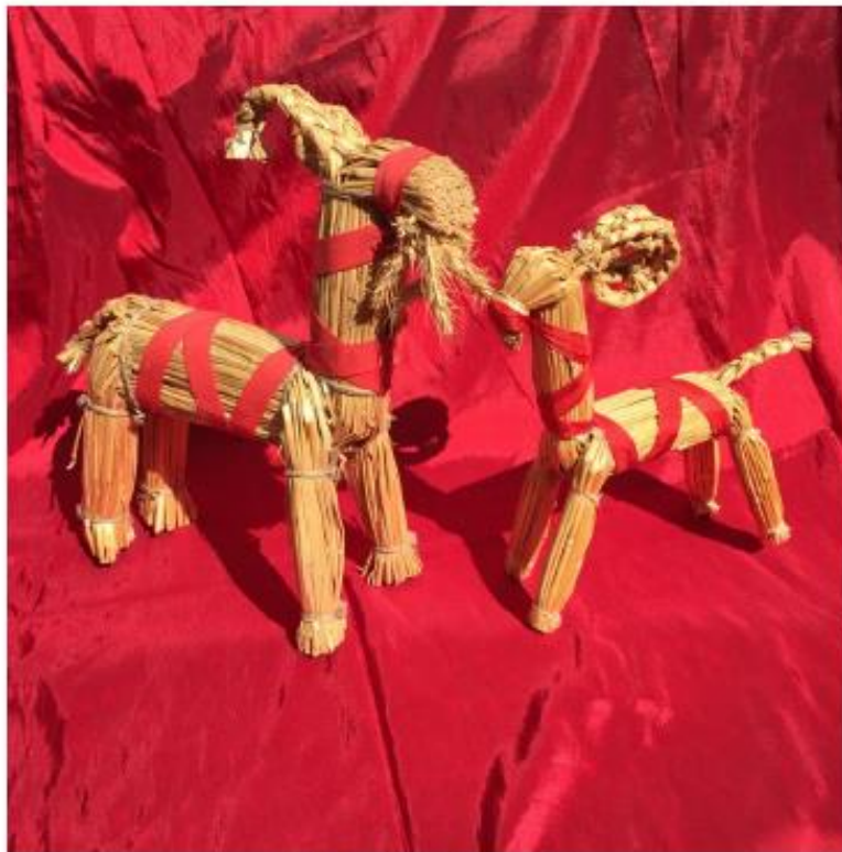
Julböcke aus Schweden

Mittwoch, 4. Dezember 2019, 9.30 Uhr, im Gemeindesaal